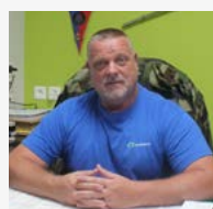
Albioma avec la construction de 12 centrales photovoltaïques

En attendant la relève, découvrez, dans ce numéro, deux porteurs de projet FEDER :